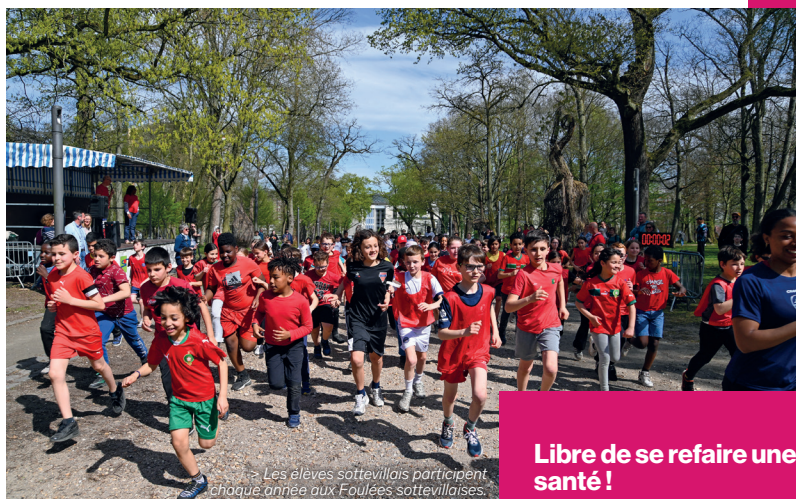
Les élèves sottevillais participent chaque année aux Foulées sottevillaises.

Partager un moment de convivialité autour d'une gymnastique adaptée afin de développer les capacités motrices et participer à l'inclusion par le sport : c'était l'objectif du club La Sottevillaise qui a accueilli la 2 e étape du challenge Adapta'Gym en décembre. Plusieurs équipes constituées de personnes en situation de handicap issues de clubs ou structures adaptées du département étaient réunies au Gymnase municipal Jean-Claude Bauer. « C'est une chance pour nous d'être accueillis dans ce lieu adapté », explique Frédérique, aide médico-psychologique au foyer de vie le Chalet de l'association des Papillons blancs. « Les adultes que nous