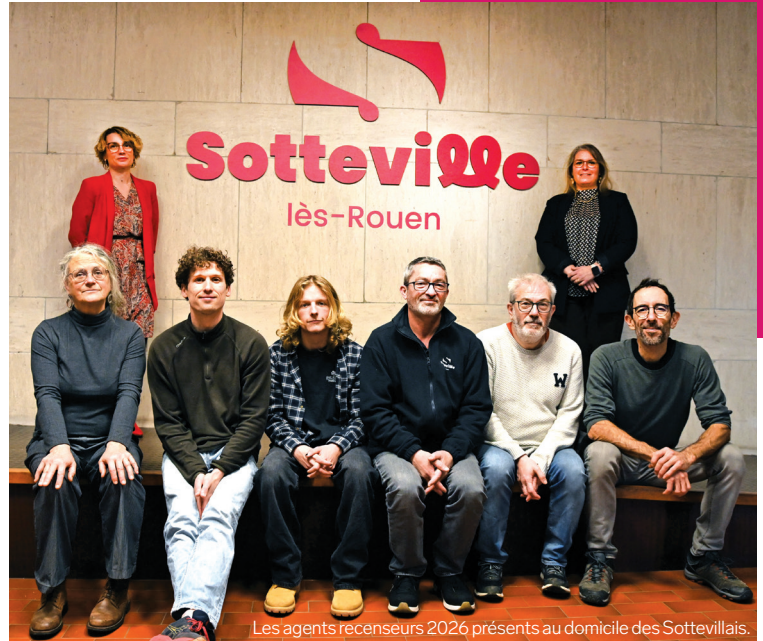
Les agents recenseurs 2026 présents au domicile des Sottevillais.

Dans tous les cas, les agents recenseurs, formés par la Ville, se rendent au domicile des habitants concernés pour leur remettre les documents de présentation de l'enquête et toutes les infos utiles pour y répondre. Seuls les porteurs d'une carte signée par monsieur le Maire Alexis Ragache sont habilités à se rendre chez les habitants concernés.