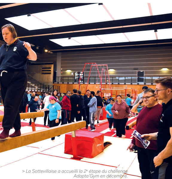
> La Sottevillaise a accueilli la 2 e étape du challenge Adapta'Gym en décembre.

Tir au but interactif, aire de fitness et de musculation ou un parcours de footing de 1,2 km, tout y est ! Aussi La Route 606, espace dédié à la marche et le parcours permanent de course d'orientation, sont deux équipements qui correspondent aux nouvelles façons de faire du sport et favorisent les recommandations de santé publique d'activité physique régulière.