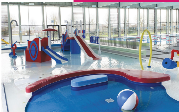
> Le projet de rénovation de la piscine municipale s'inspire en partie du centre aquatique L'effet bleu de Saint-Romain-de-Colbosc.

Après une phase de concertation auprès des Sottevillaises et Sottevillais, puis deux études menées par la maîtrise d'ouvrage, le projet de réaménagement de la piscine municipale livre ses premières orientations.