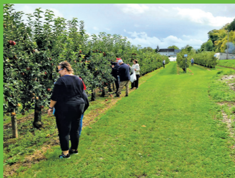
Sortie cueillette de pommes (octobre 2024)