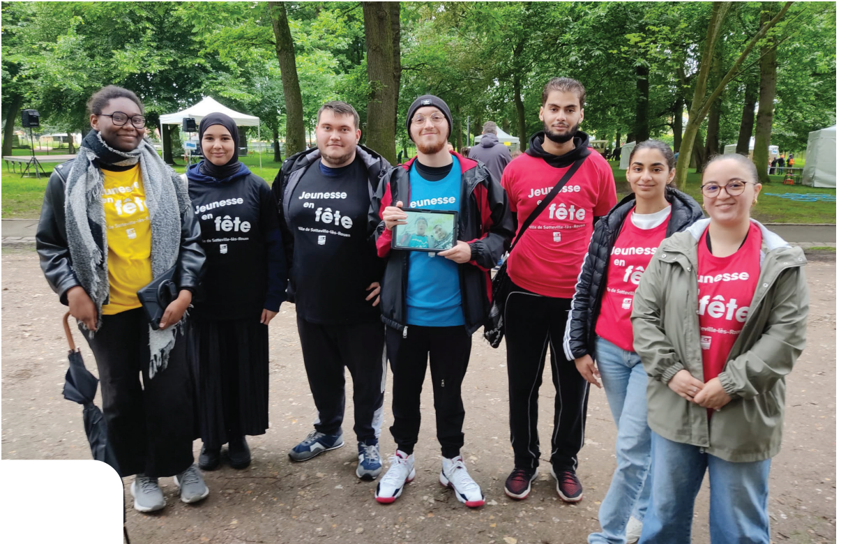
> Le Conseil de jeunes Sottevillais a assisté aux Jeux Paralympiques de Paris 2024. Les membres étaient également sur le terrain lors de Jeunesse en fête.