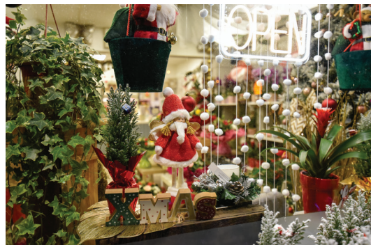
> La boutique Parfum de fleurs, vitrine gagnante 2023.

Un tirage au sort sera effectué parmi les internautes ayant interagi avec les publications du calendrier de l'Avent. Le commerçant ayant gagné le concours remettra le lot.